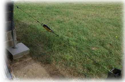
Vue d'ensemble du dispositif