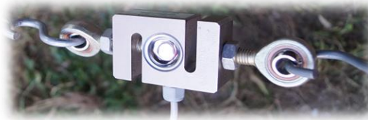
Capteur externe de force

Treuil mécanique permettant de mettre le câble en tension jusqu'à déformation maximale.