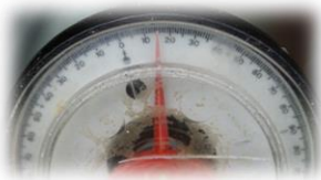
Angle d'inclinaison du câble 15°

La base bétonnée est réhaussée d'un bloc en acier de 5 cm d'épaisseur, renforçant le dispositif.