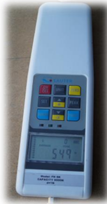
Dynamomètre FH 5K - SAUTER

Dynamomètre digital de 5000N ( + capteur externe)